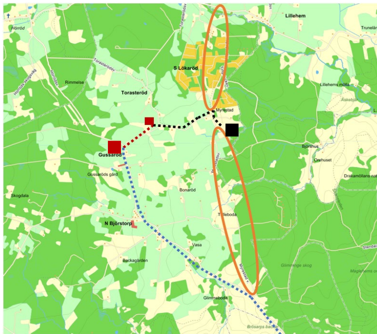
Figur 3. Trafikverkets väg i blått. Väg till upplag, bodar i grundförslag i rött. Förlängning av körväg i nuvarande bygglovsförslag samt förslag på upplag, parkering och arbetsbodas i svart. Myrestadsvägen inringad dels emot Lillehemsvägen dels mot Hörödsvägen som kan medföra ökad trafikbelastning.