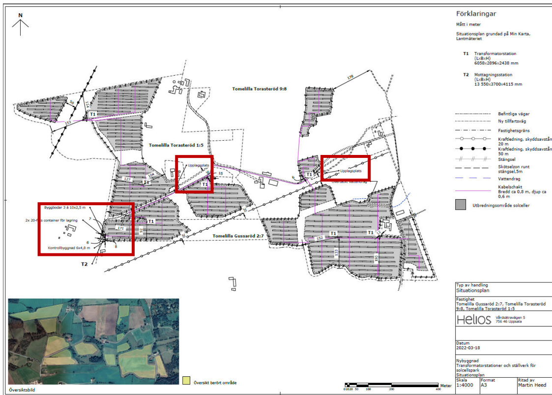
Figur 2. Situationsplan byggbodar och upplag i grundförslag markerat i rött